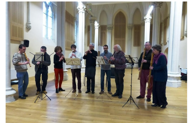
Le CA lors du Congrès 2013 (Laval)

Association des Musiciens Enseignants la Flûte à bec