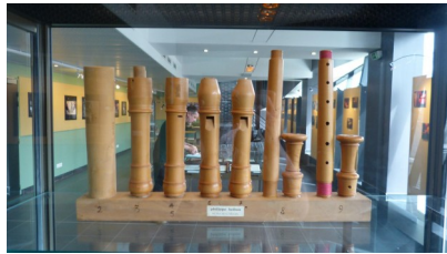
Vitrine de l'exposition lors des Rencontres Nationales (Montargis)

Chacune de ces rencontres propose des facettes variées de la vie flûtistique française, mêlant interprètes, facteurs, enseignants mais aussi scientifiques, historiens et chercheurs.