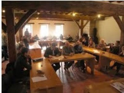
AG 2012 (Saint-Rémy-les-Chevreuse)

Cet échange est constructif, motivant pour l'enseignement.